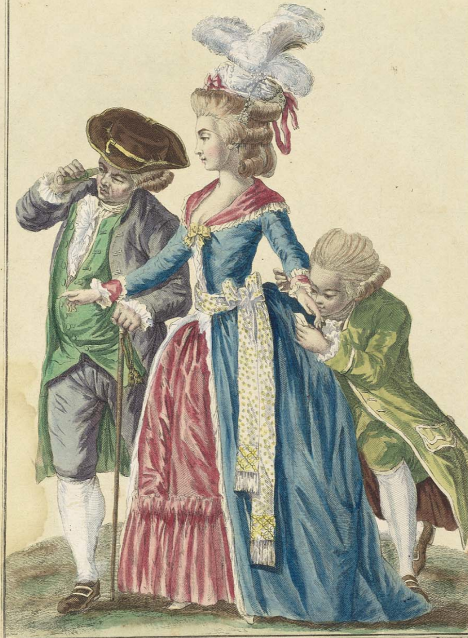
Lecteur del. Femme vêtue d'un Lévite uni bordée d'une bande de Gaze plissée, la Ceinture à la dernière mode de ruban moucheté à noeuds et franges au bout, elle est coiffée d'un turban ou toque à la Levantine retrouillée de Perles et surmontée de plumes en panaches sur une frisure demie négligée et fort lâche.

A Paris chez Esnauts et Rapilly, rue S t Jacques à la ville de Coutances Avec Privil. du Roi.