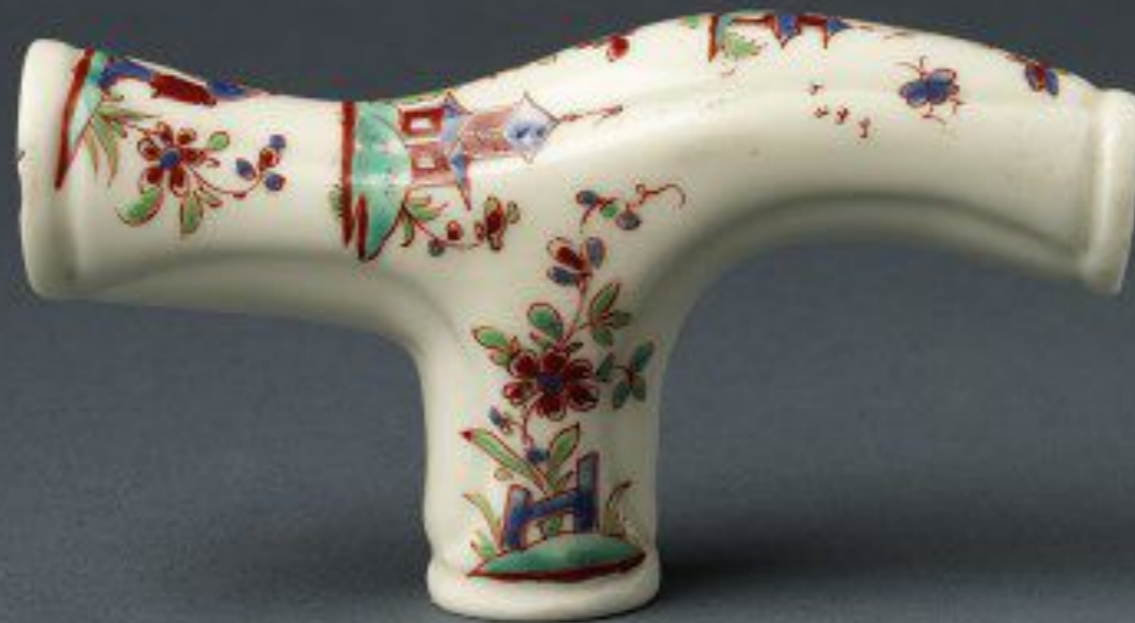
French Soft - Paste Porcelain Walking Stick Handle Mannaecy Porcelain Factory c. 1735 - 1740 (Victoria & Albert)