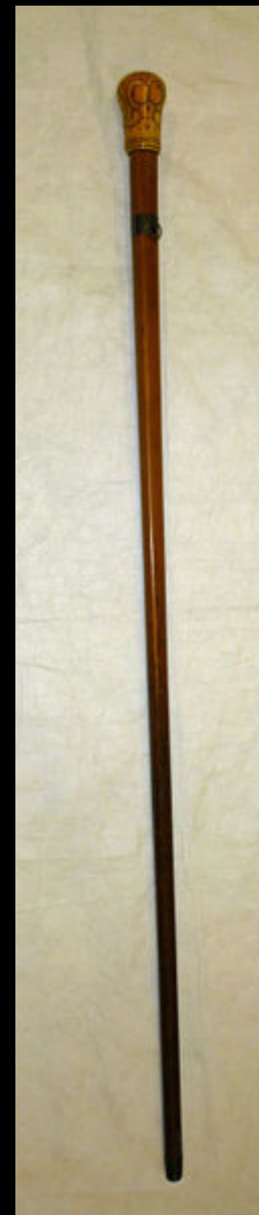
Dutch Malacca Walking Stick with a Silver Pique - Inlay Ivory Handle & Metal Ferrule Dated 1699 (Victoria & Albert)