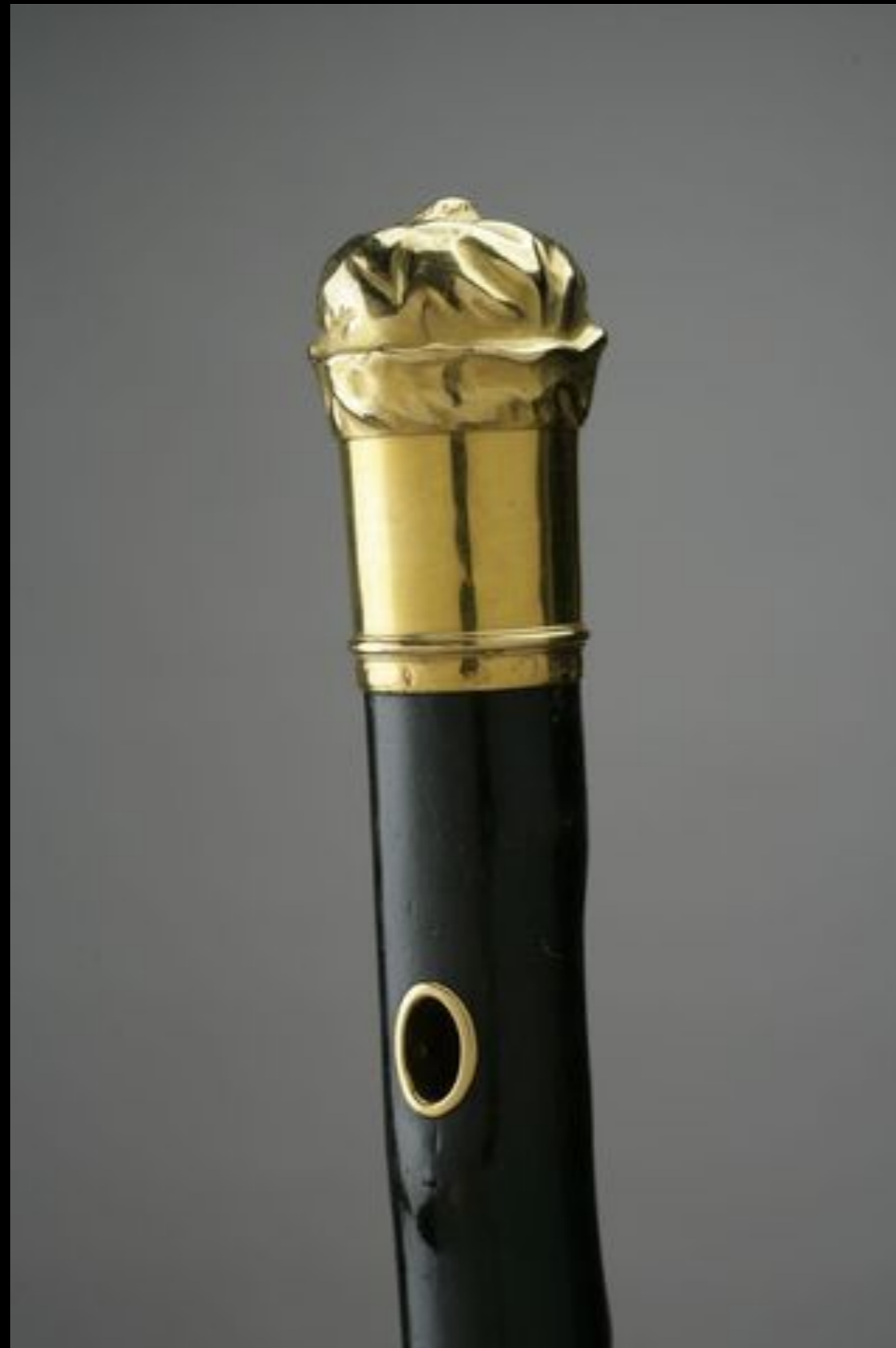
French Walking Stick with Gold Handle & Gold Ferrule Presented to American Ambassador Benjamin Franklin Designed to Represent the Fur Cap He Wore While in France 1783 (National Museum of American History)