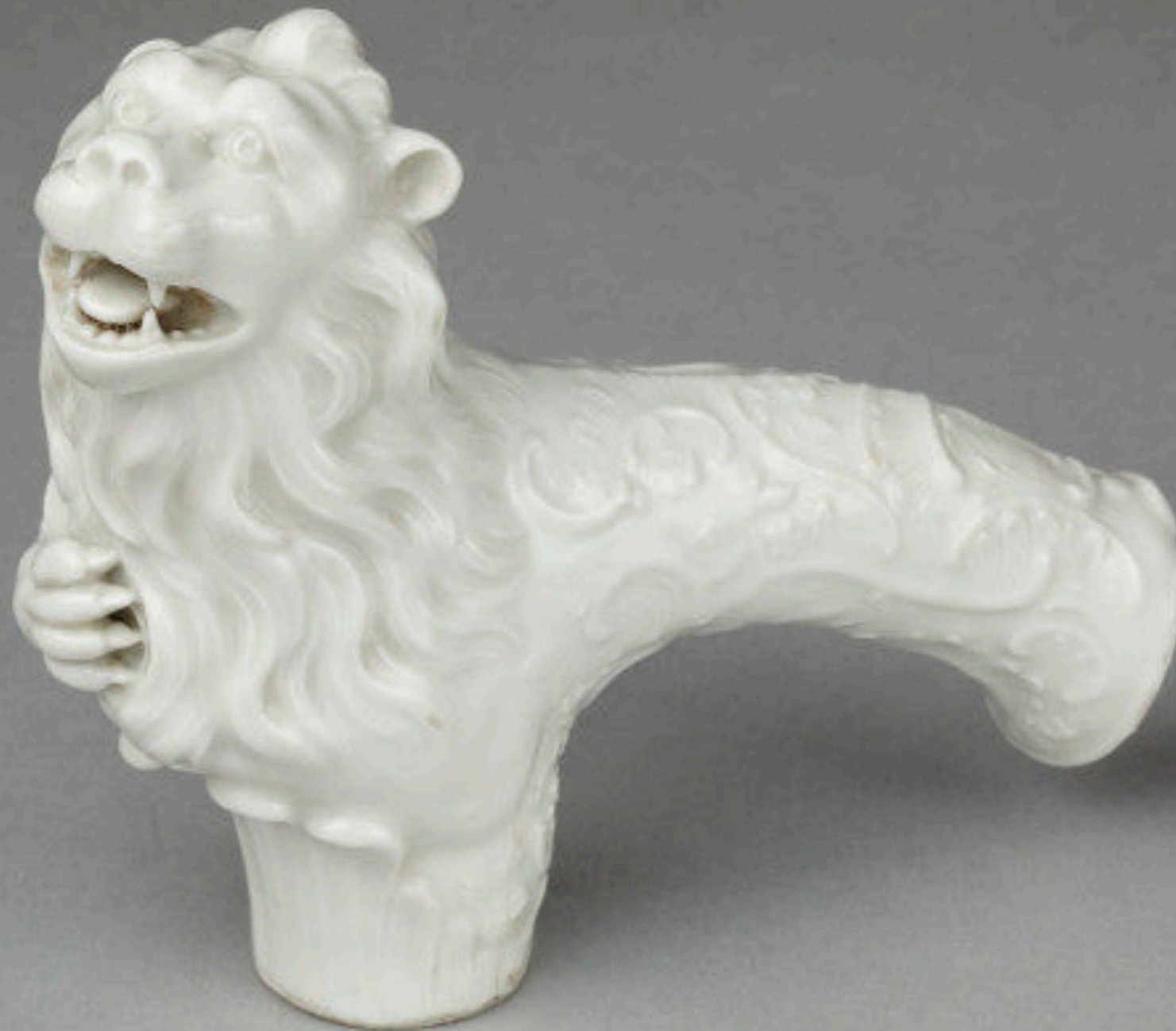
German Meissen Hard - Paste Porcelain Walking Stick Handle c. 1740 - 1745 (Victoria & Albert)