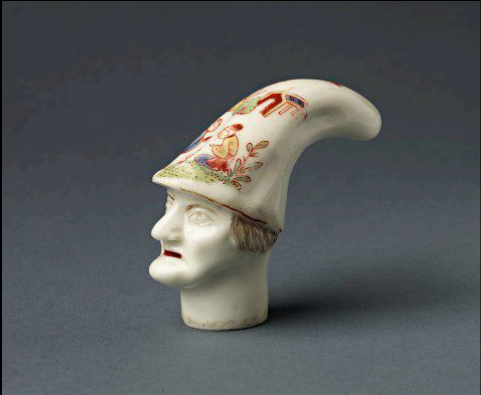
French Soft - Paste Porcelain Walking Stick Handle The Saint - Cloud Porcelain Factory c. 1700 - 1750 (Victoria & Albert)