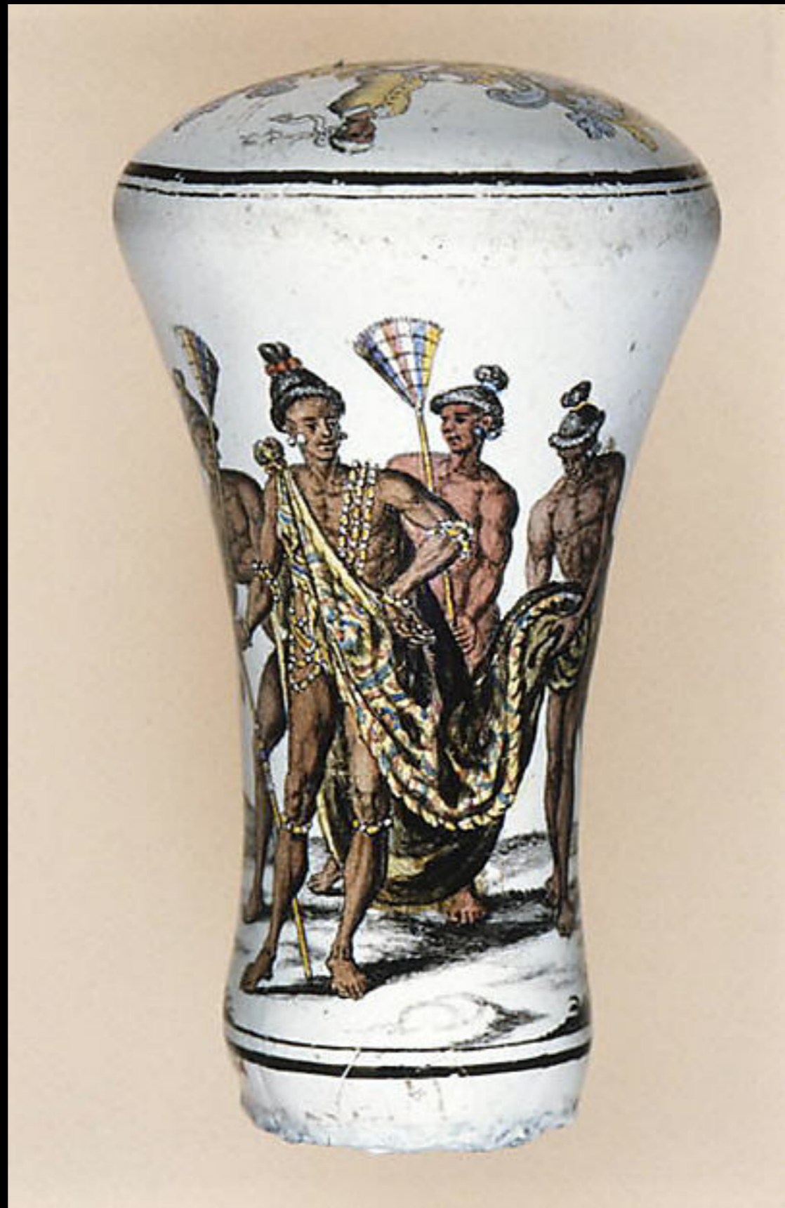
German (Rhenish) Painted Enamel on Copper Walking Stick Handle c. 1750 - 1790 (Metropolitan Museum of Art)