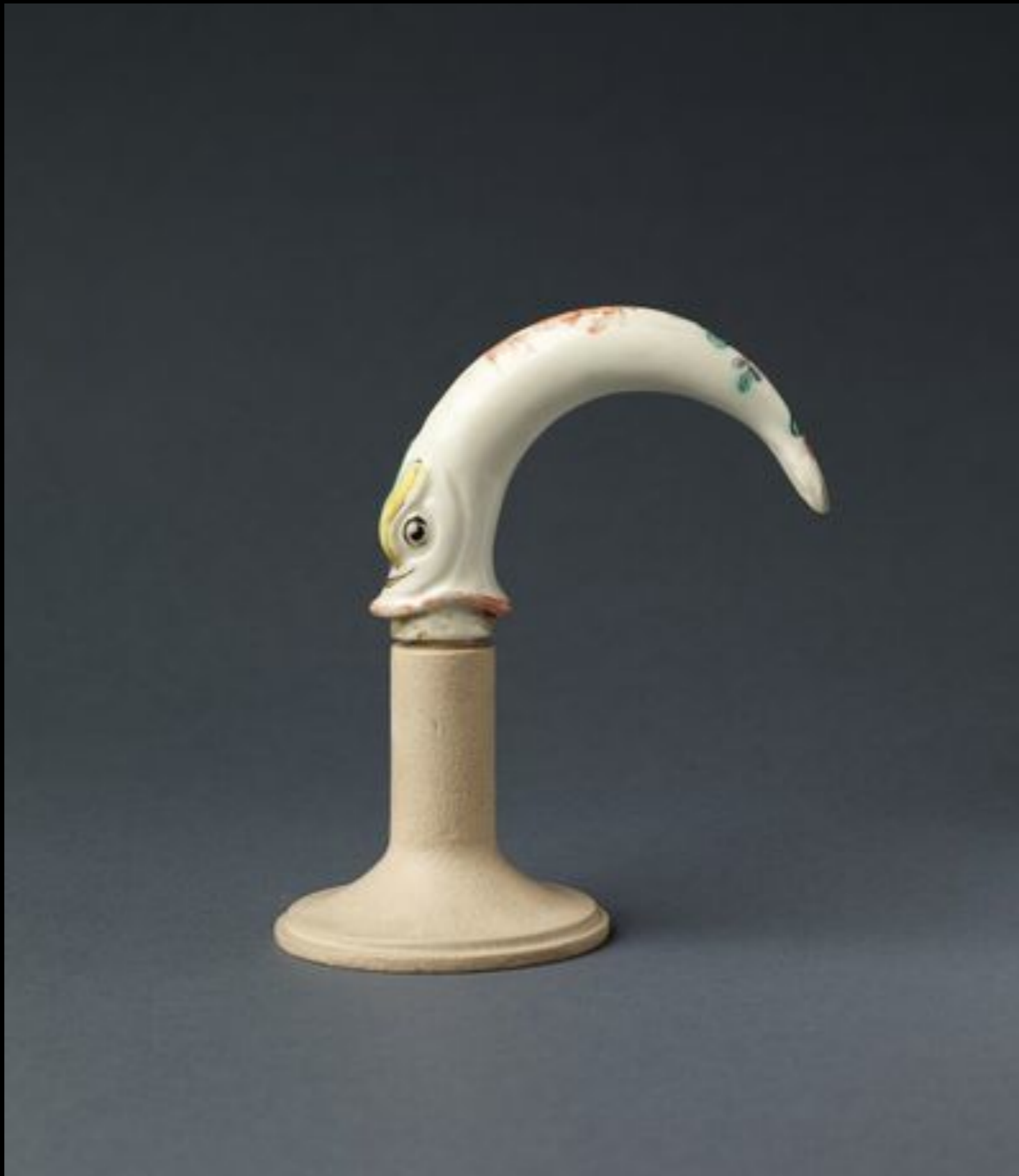
French Soft - Paste Porcelain Walking Stick Handle The Saint - Cloud Porcelain Factory c. 1730 - 1760 (Victoria & Albert)