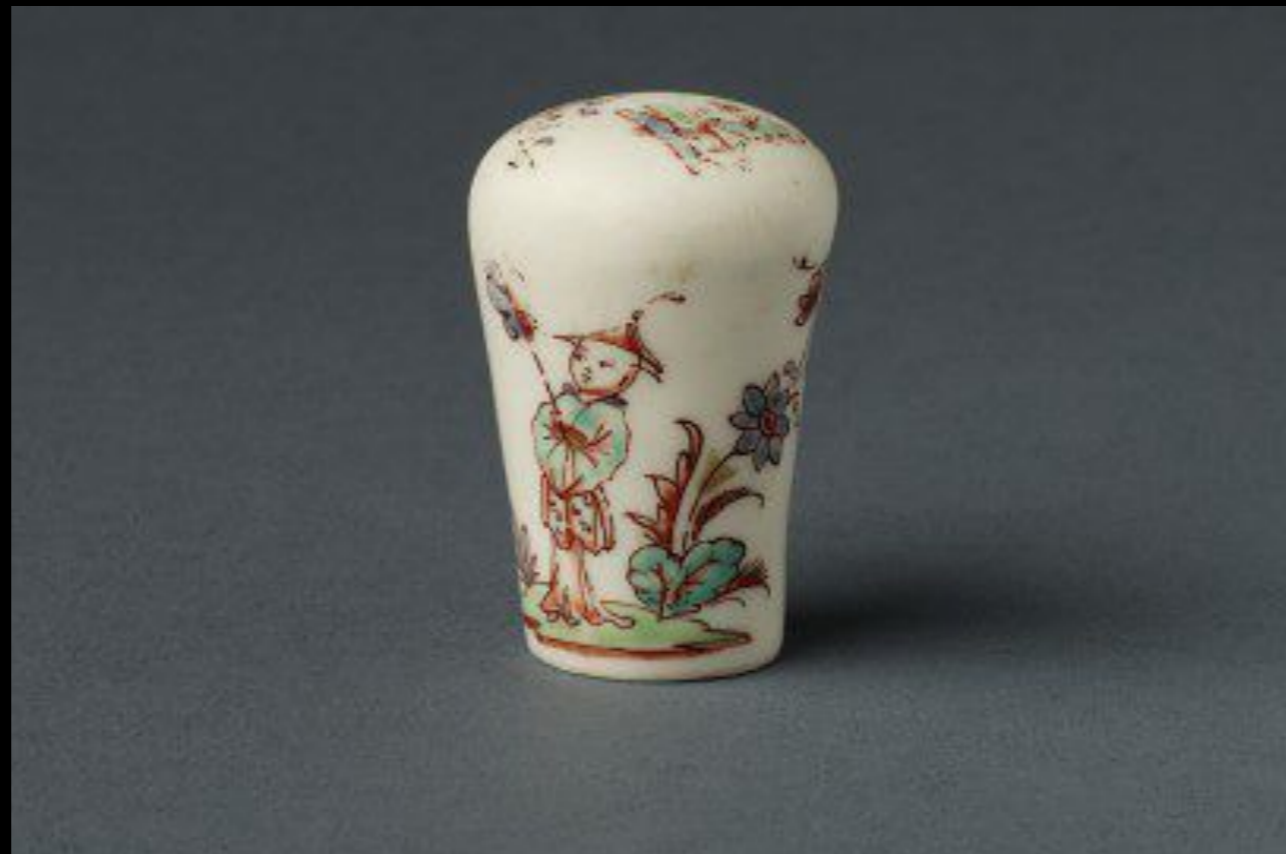
French Soft - Paste Porcelain Walking Stick Knob Handles The Saint - Cloud Porcelain Factory c. 1700 - 1750 (top), c. 1730 - 1740 (bottom)