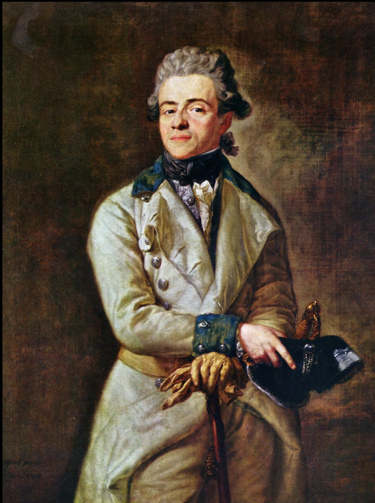
Erbprinzen Heinrich XIII by Anton Graff c. 1780 (Alte Pinakothek)