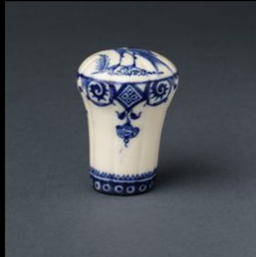
French Soft - Paste Porcelain Walking Stick Knob Handles The Saint - Cloud Porcelain Factory c. 1700 - 1750