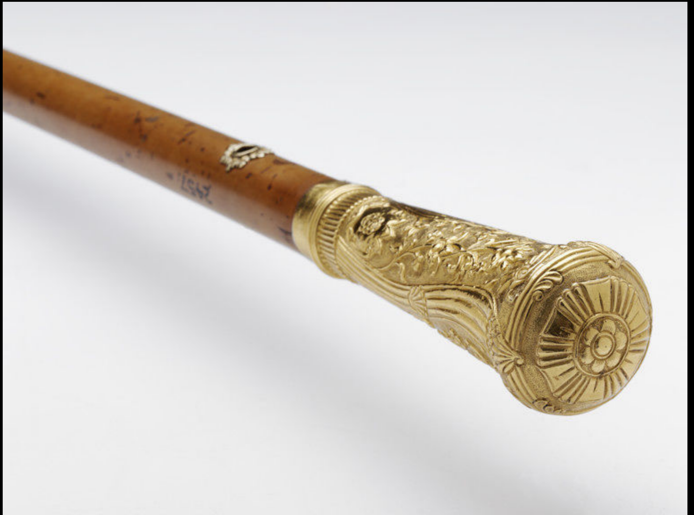
Indian Malacca Walking Stick with Repousse Gold Handle, Gold Ring, and Steel Ferrule c. Late 18th Century (Victoria & Albert)