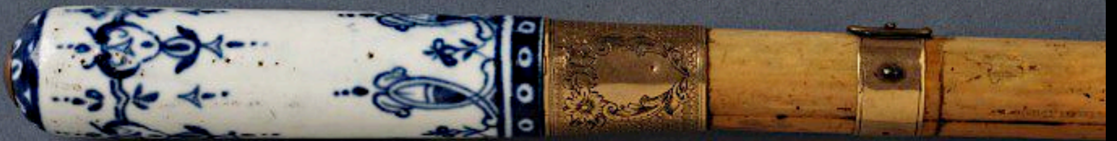
French Malacca Cane with Soft - Paste Porcelain Handle, Engraved Gold Collar, & Gold Band Saint - Cloud Porcelain Factory c. 1700 - 1725 (Victoria & Albert)