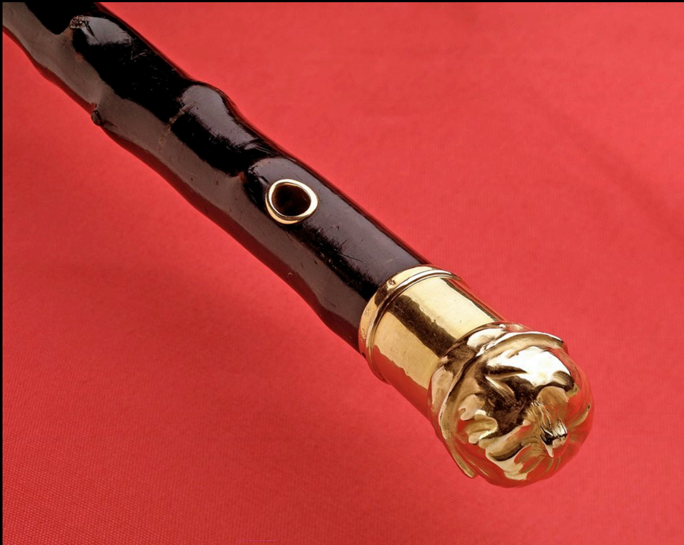
French Walking Stick with Gold Handle & Gold Ferrule Presented to American Ambassador Benjamin Franklin Designed to Represent the Fur Cap He Wore While in France 1783 (National Museum of American History)