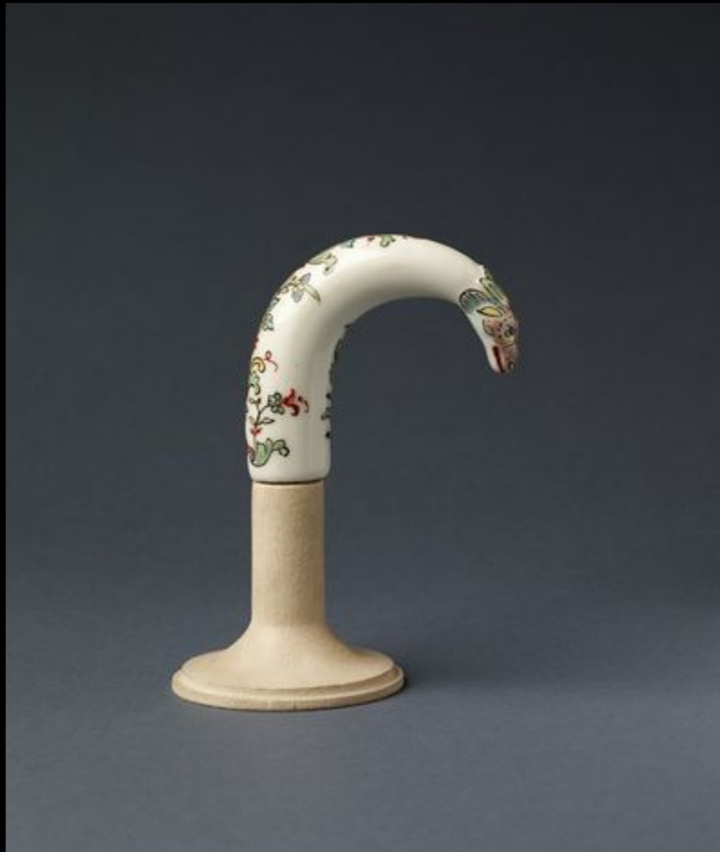
French Soft - Paste Porcelain Walking Stick Handle The Saint - Cloud Porcelain Factory c. 1720 - 1740