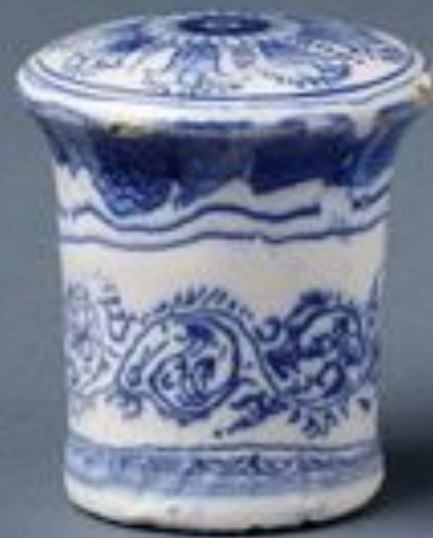
French Tin - Glazed Earthenware Walking Stick Knob Handle from Moustiers c. 1720 - 1740 (Victoria & Albert)