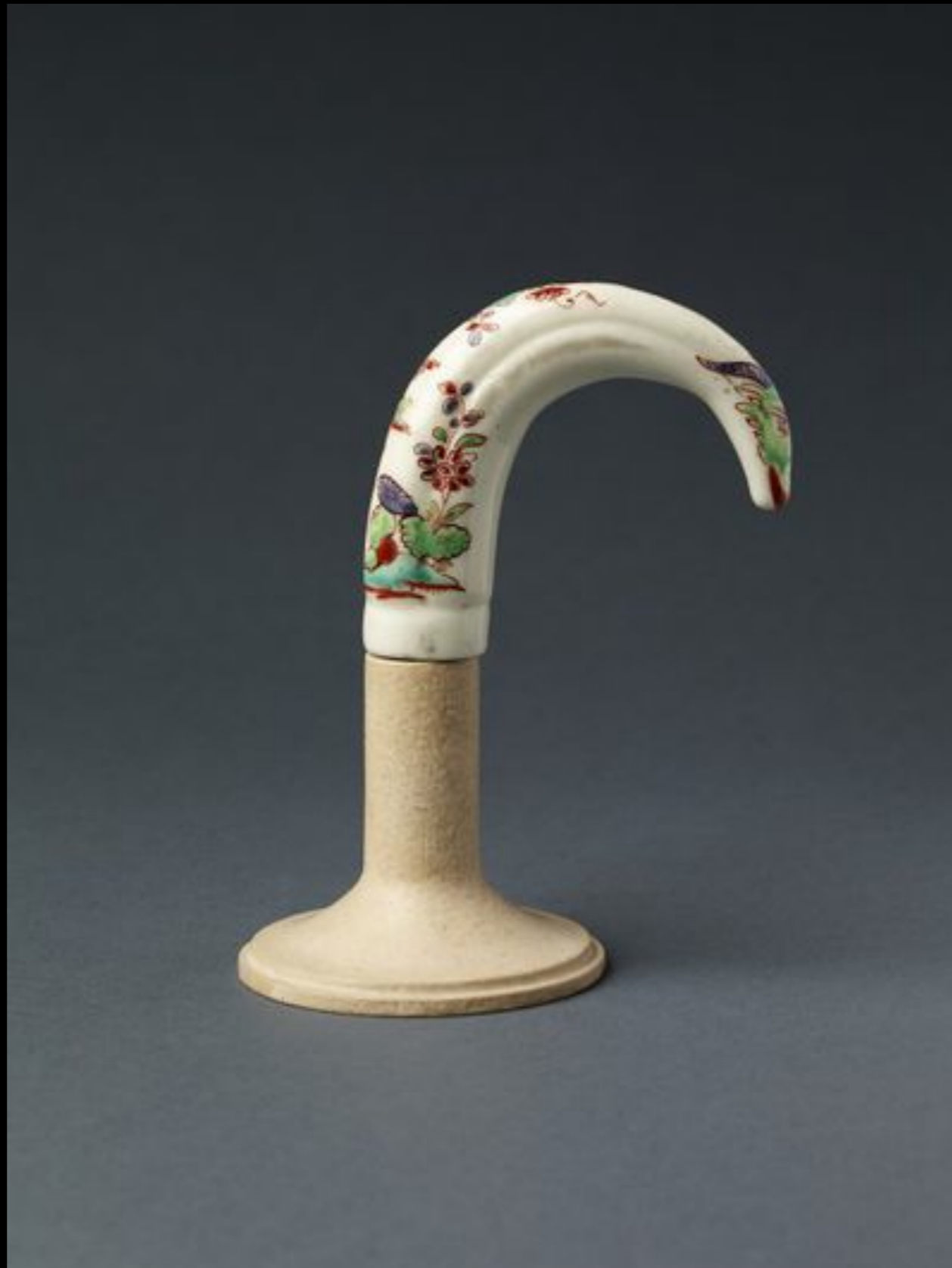
French Soft - Paste Porcelain Walking Stick Handle Mannaecy Porcelain Factory c. 1735 - 1745 (Victoria & Albert)