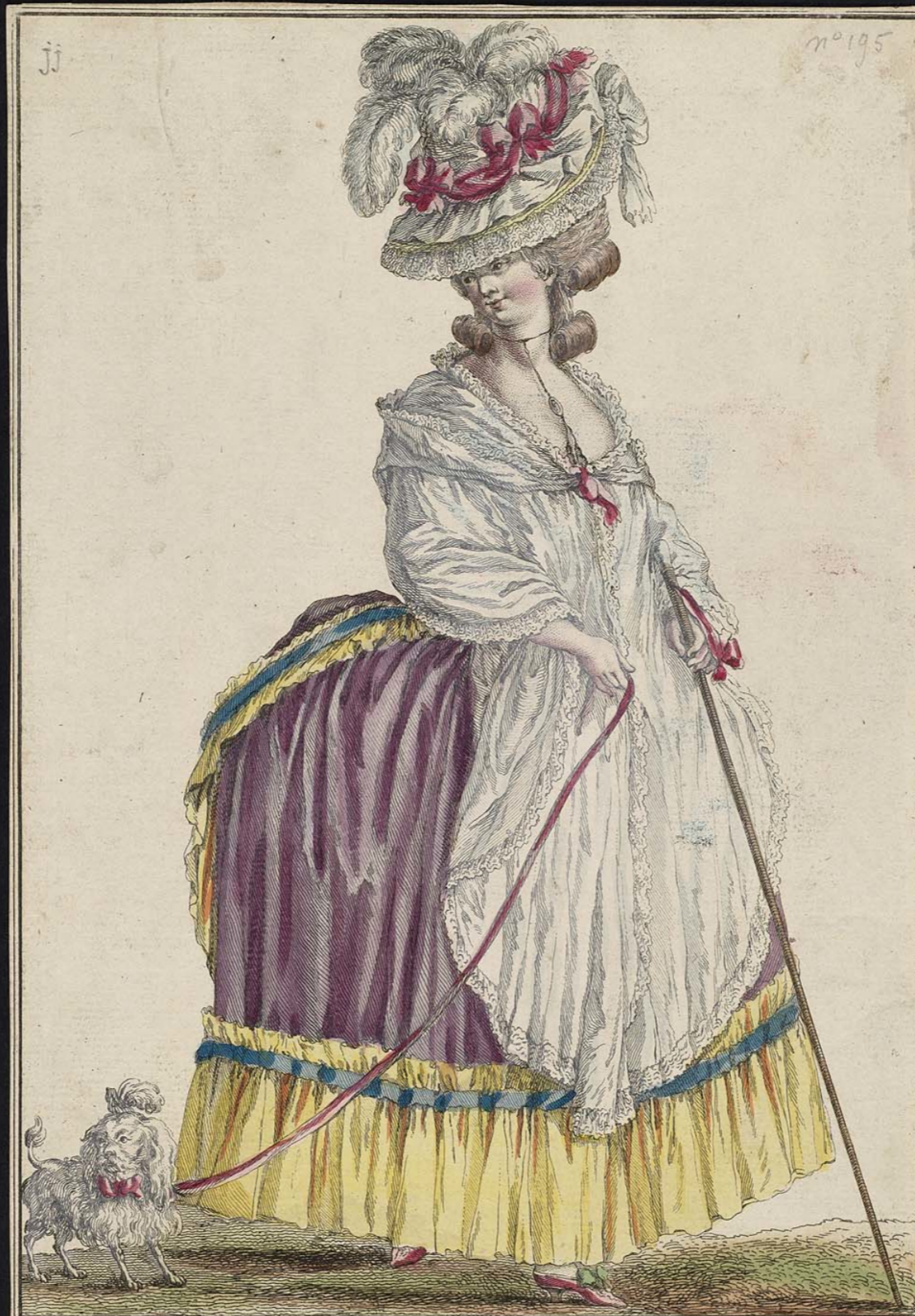
Dessiné par Le Clerc Gravé par Pellicier Jeune femme en robe à la Polonoise avec un grand mantelet blanc à la mode: elle est coiffée d'un chapeau en parasol, garni de blonde rabattue tout autour, et surmonté d'un bouquet de plumes.