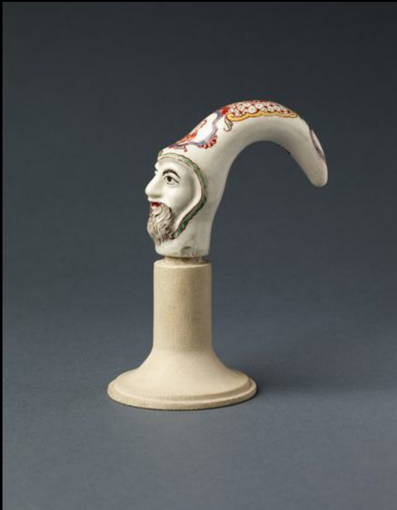
French Soft - Paste Porcelain Walking Stick Handle The Saint - Cloud Porcelain Factory c. 1730 - 1760 (Victoria & Albert)