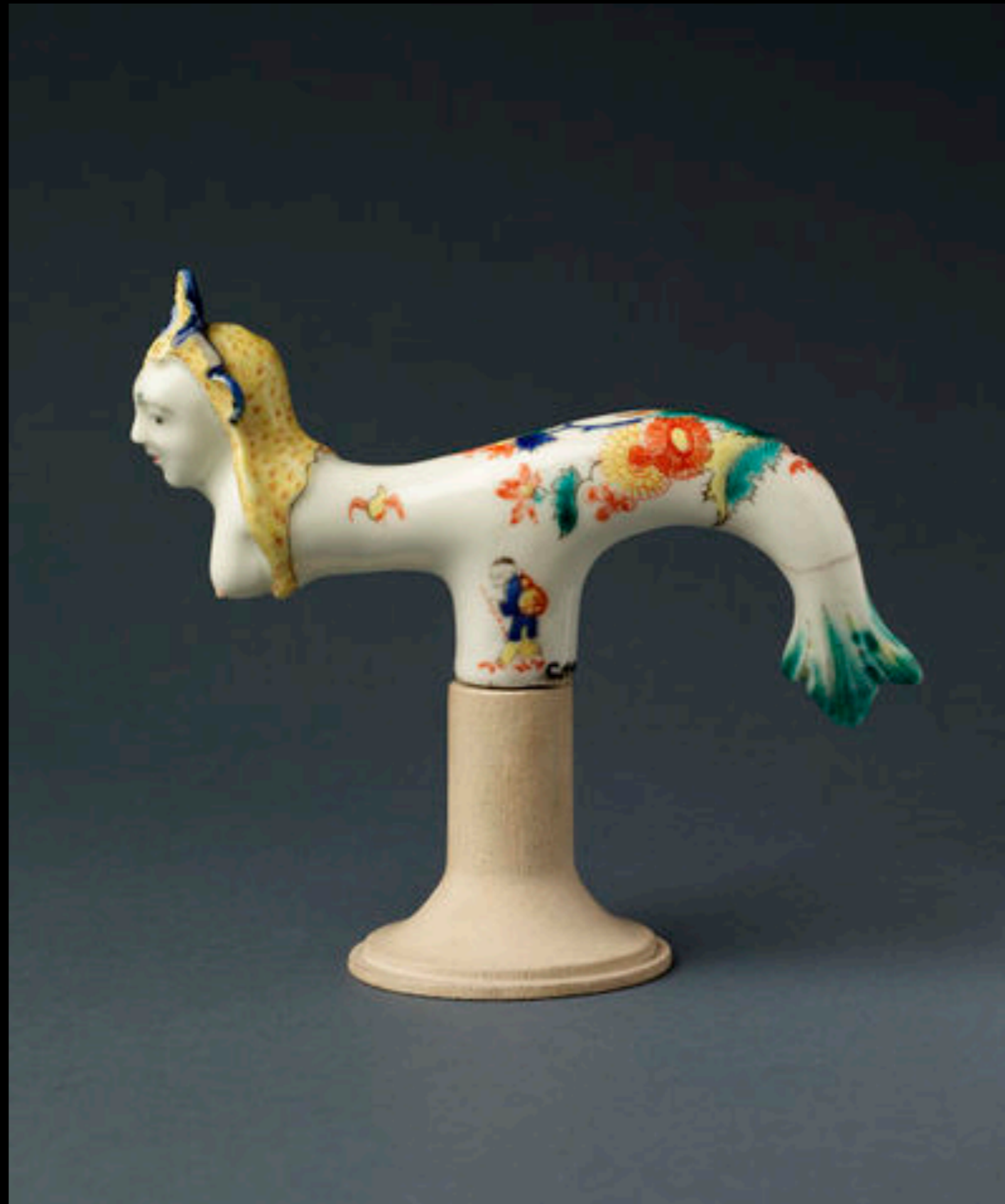
French Soft - Paste Porcelain Walking Stick Handle The Saint - Cloud Porcelain Factory c. 1730 - 1739 (Victoria & Albert)