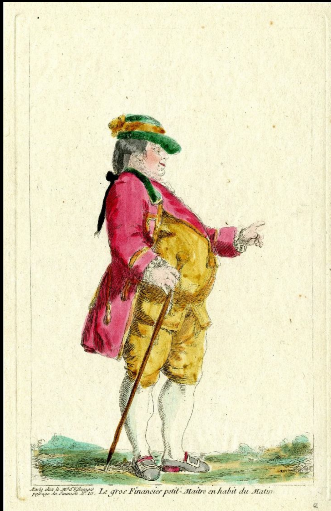
“Le gros Financier petit - Maître en habit du Matin” c. 1775 - 1785