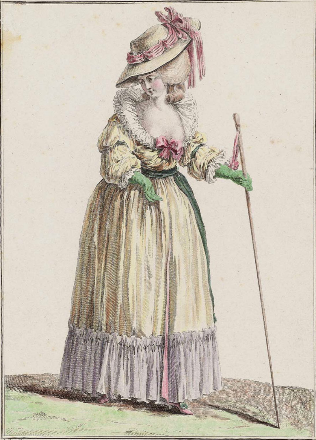
Le Clerc delin. Dupin sculp. Chemise à la Reine à manches attachées, la gorge garnis d'une fraize, Chapeau à la Malboroug' entouré d'un ruban large rayé noir et de couleur. A Paris chez Esnauts et Rapilly, Rue S t Jacques à la Ville de Coutances.