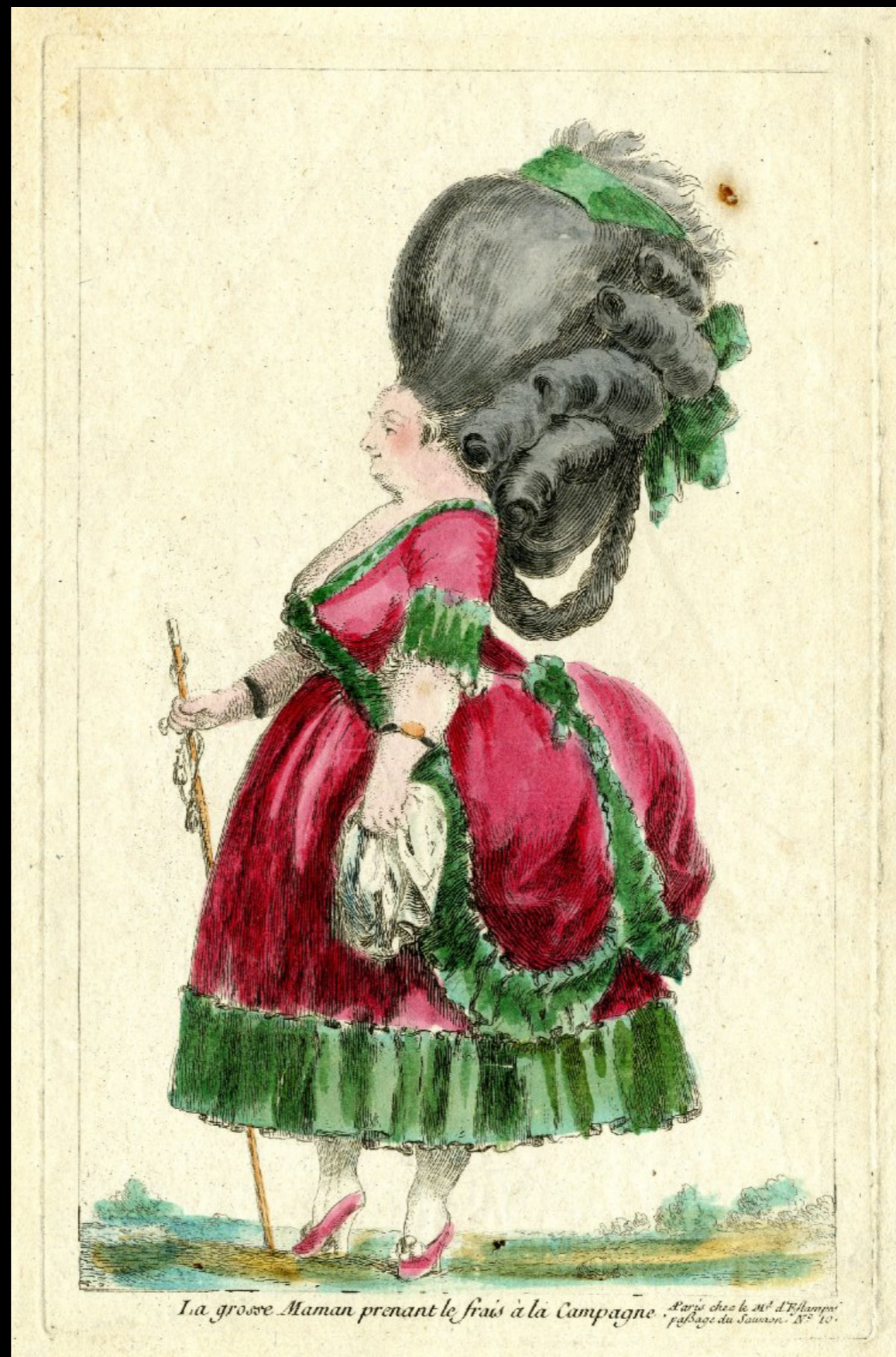
“La grosse Maman prenant le frais à la Campagne” c. 1775 - 1785