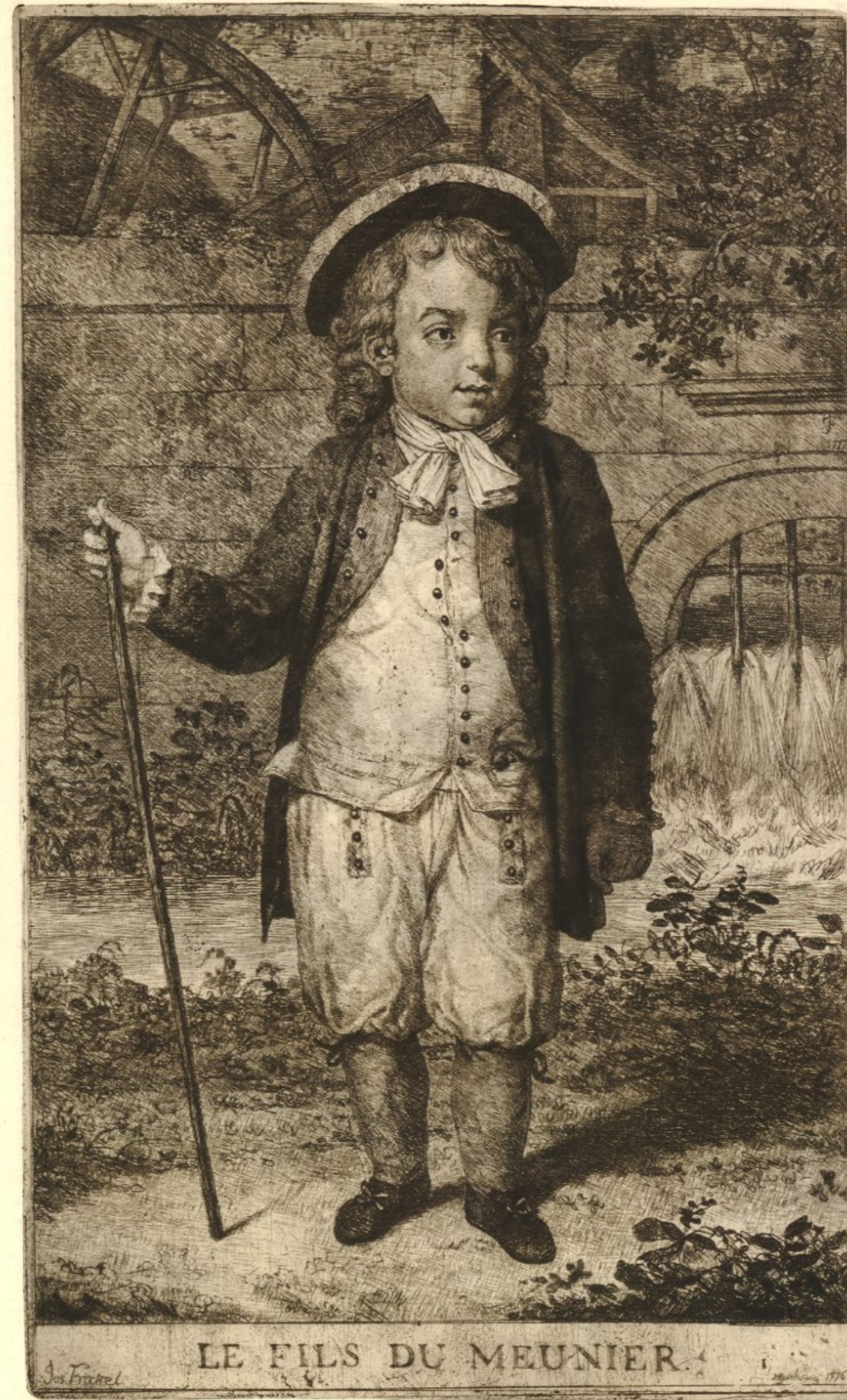
“LE FILS DU MEUNIER” by Joseph Frataral 1776 (The British Museum)