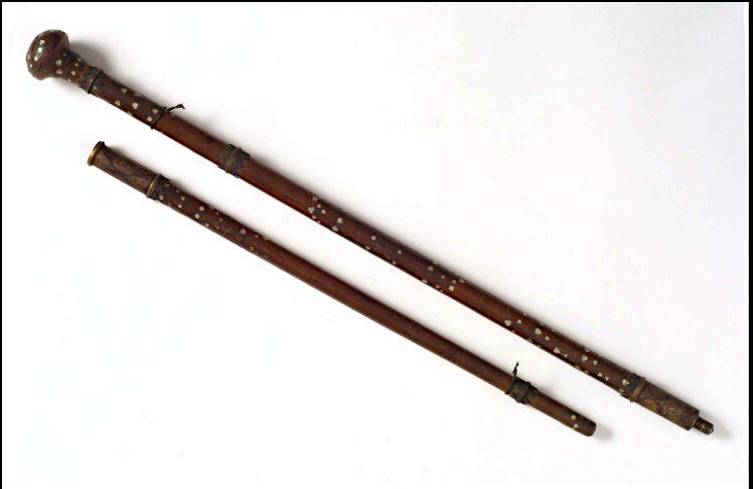
Dutch Wood Walking Stick Inlaid with Mother - of - Pearl, Wire, & Chased Metal c. 1550 - 1700 (Victoria & Albert)