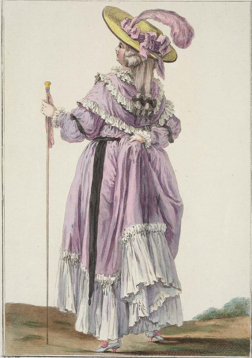
Le Clerc delin. Dupin Sculp. Chemise à la Reine vue par derriere. Cette Femme a sur les épaules un fichu-mantelet, elle est coiffée d'un chapeau plat surmonté d'une plume, les cheveux en négligé et deux catogans, la ceinture est de velour noir A Paris chez Esnauts et Rapilly, Rue S t Jacques à la Ville de Cochin.