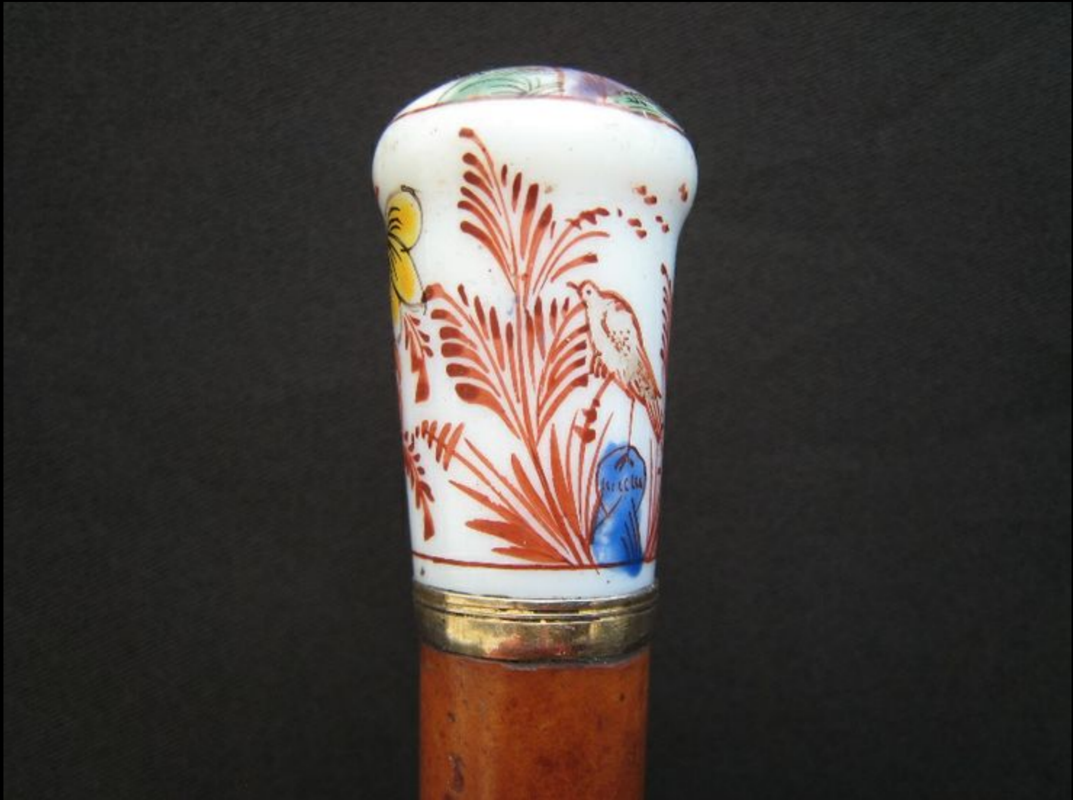
French Malacca Walking Stick with Opal Glass Chinoiserie Knob Handle & Brass Collar c. 1770 (Antique Canes Amsterdam)