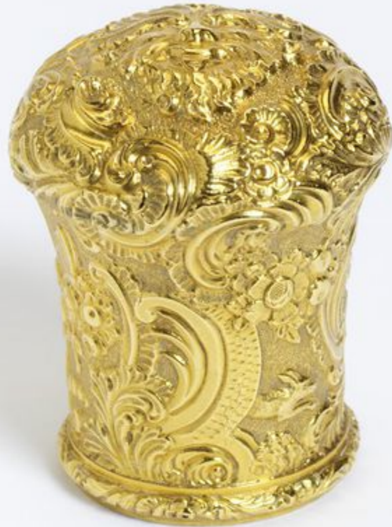
German Chased & Embossed Gold Walking Stick Handle c. 1740 - 1760 (Victoria & Albert)