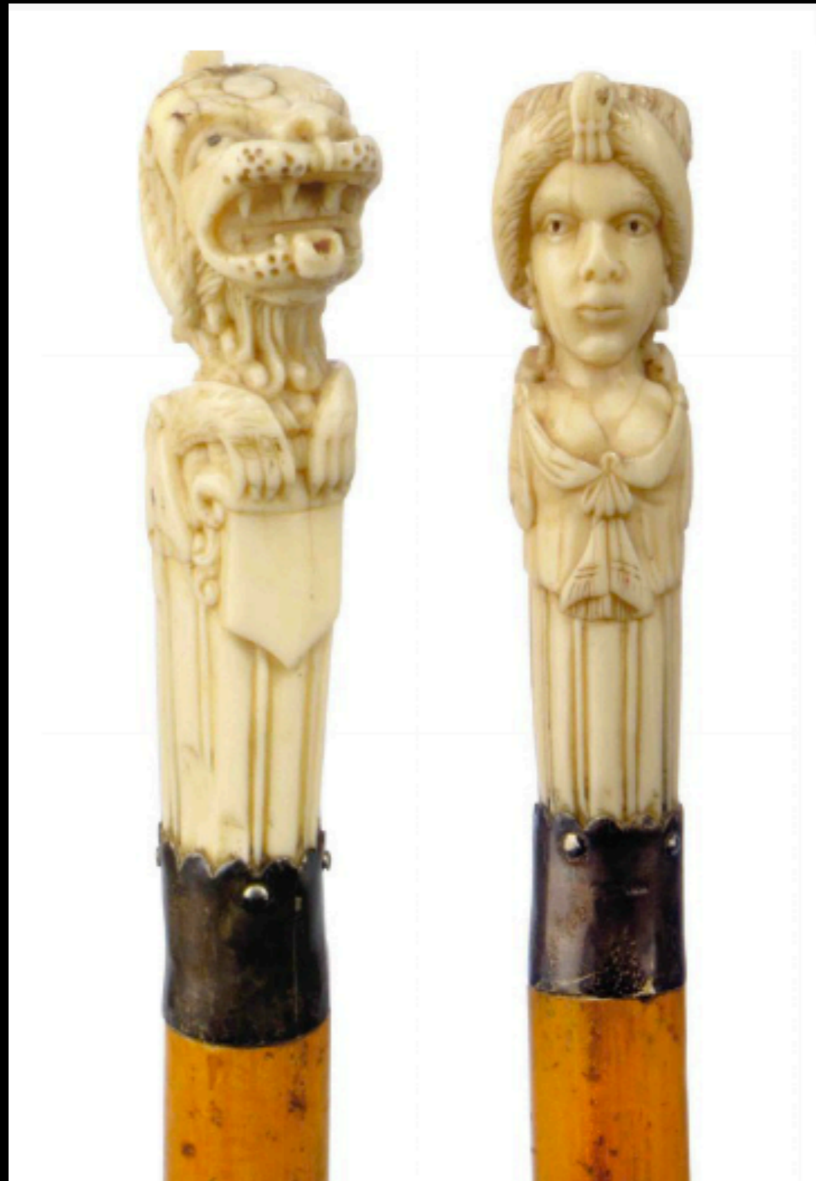
German Walking Stick with an Ivory Handle & Silver Band Collar 18th Century