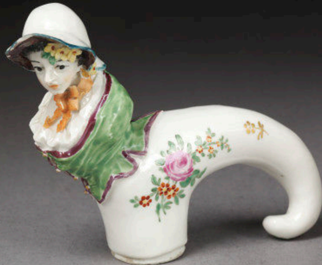
German Hard - Paste Porcelain Walking Stick Handle by Carl Vogelmann, Kelsterbach Porcelain Factory c. 1760 (Victoria & Albert)