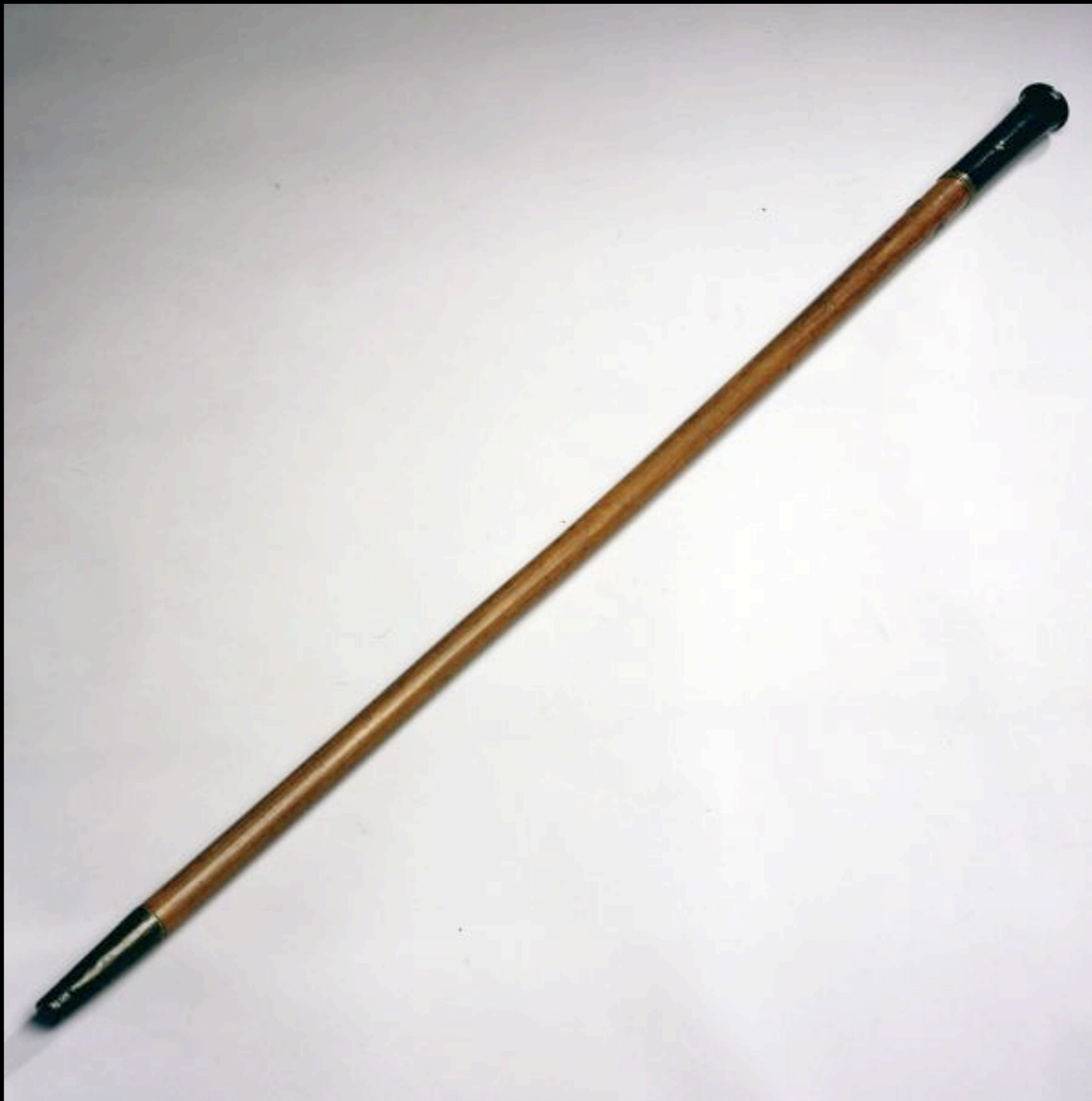
French Mahogany Walking Stick with Brass & Silver Owned by Benjamin Franklin & Given to the Marquis de Lafayette Late 18th Century