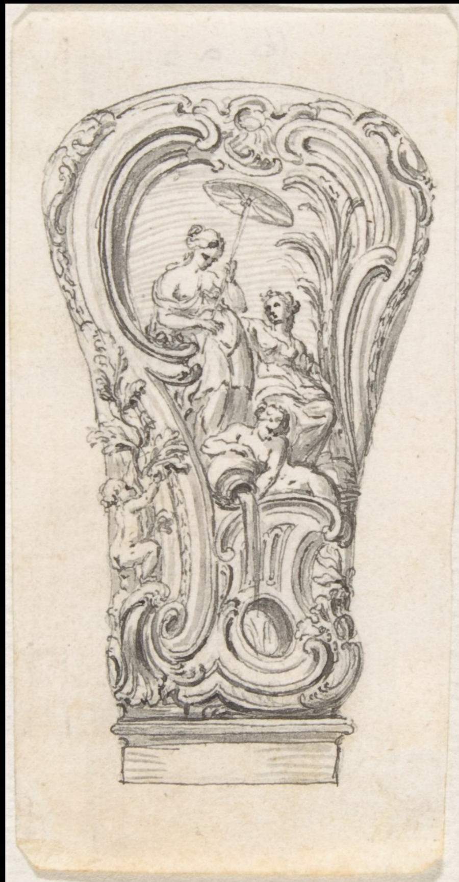
Design for a Repoussé Walking Stick Handle by Juste Aurèle Meissonnier (Turin 1695 - 1750) (Metropolitan Museum of Art)