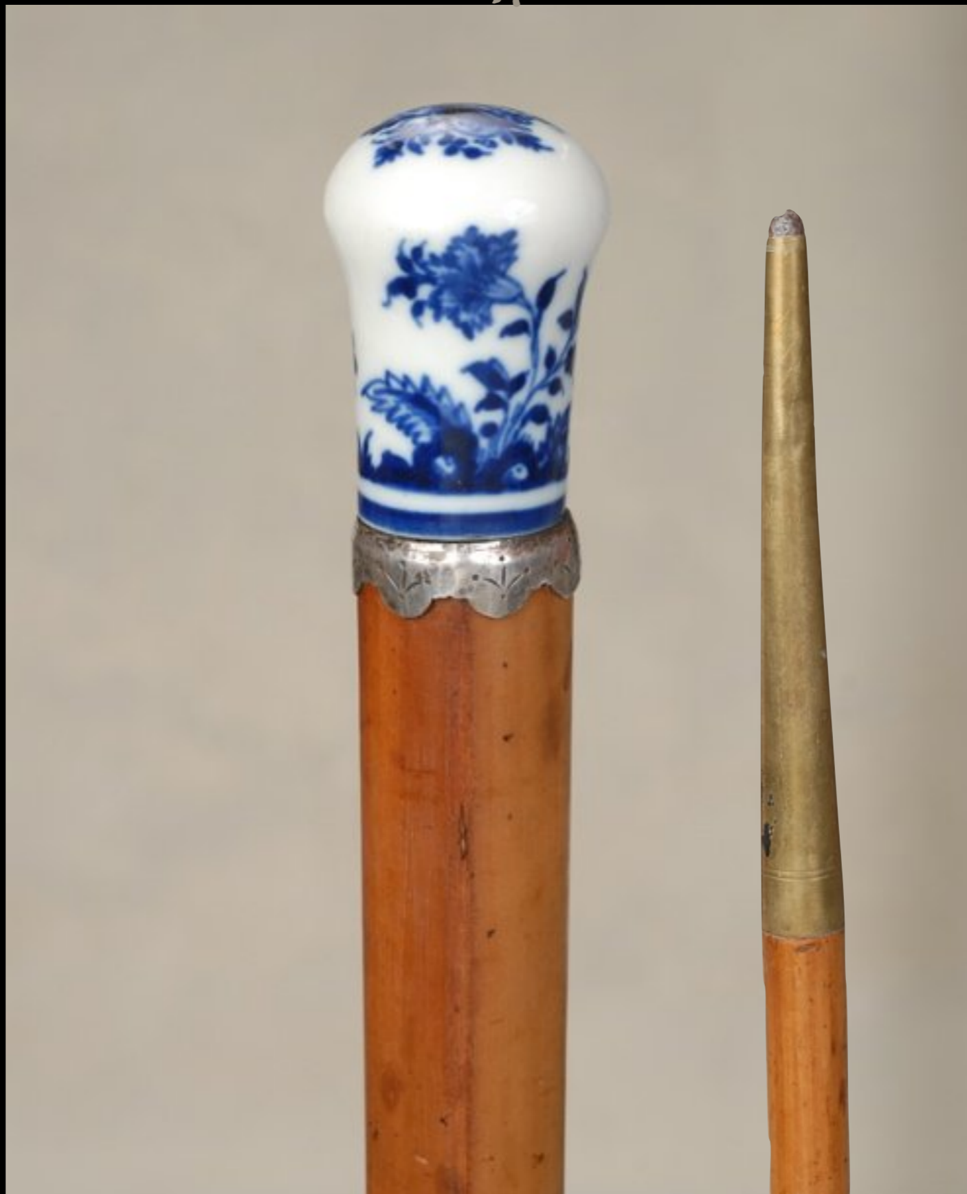
French Walking Stick with Tin - Glazed Earthenware Knob Handle, Silver Collar, & Brass Ferrule The Saint - Cloud Porcelain Factory c. 1700 - 1750