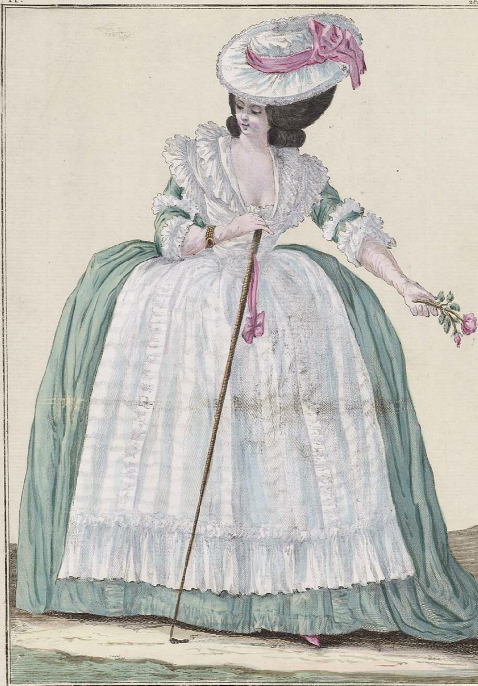
Robe à l'Anglaise, Fichu-en-Mantelet, Chapeau de Gaze.

A Paris chez Esnauts et Rapilly, Rue S t Jacques à la Ville de Coustances. A.P.D.R.