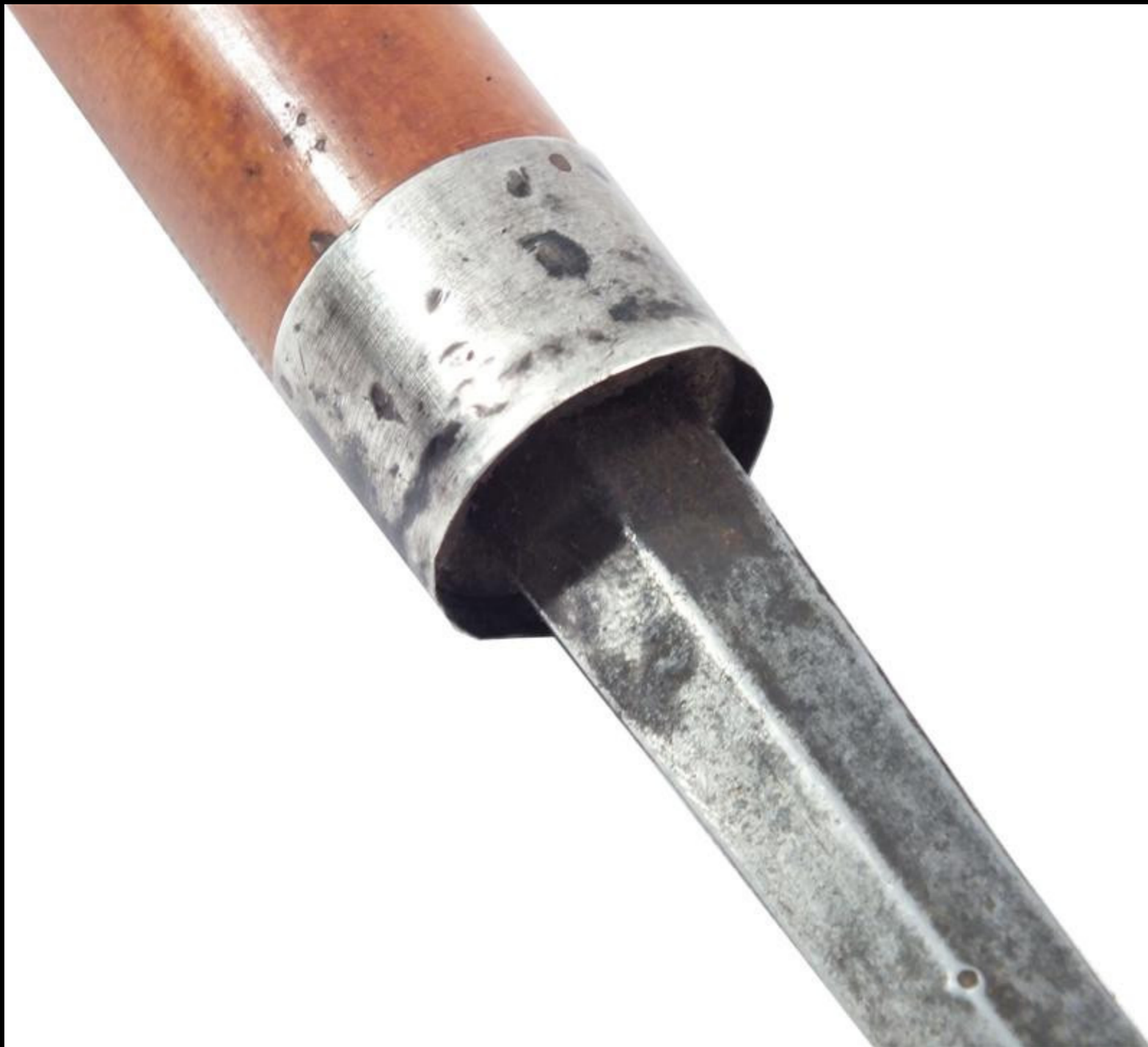
Malacca Walking Stick with a Silver Knob Handle & Concealed Rapier Form Blade Late 18th Century (Fanganarms)