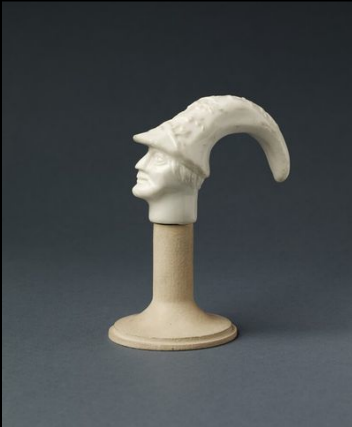
French Soft - Paste Porcelain Walking Stick Handle The Saint - Cloud Porcelain Factory c. 1730 - 1750 (Victoria & Albert)