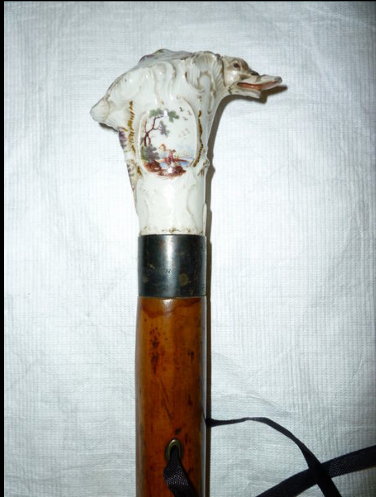
German Malacca Walking Stick with Hard - Paste Porcelain Handle & Engraved Silver Collar c. 1750 - 1759 (Victoria & Albert)