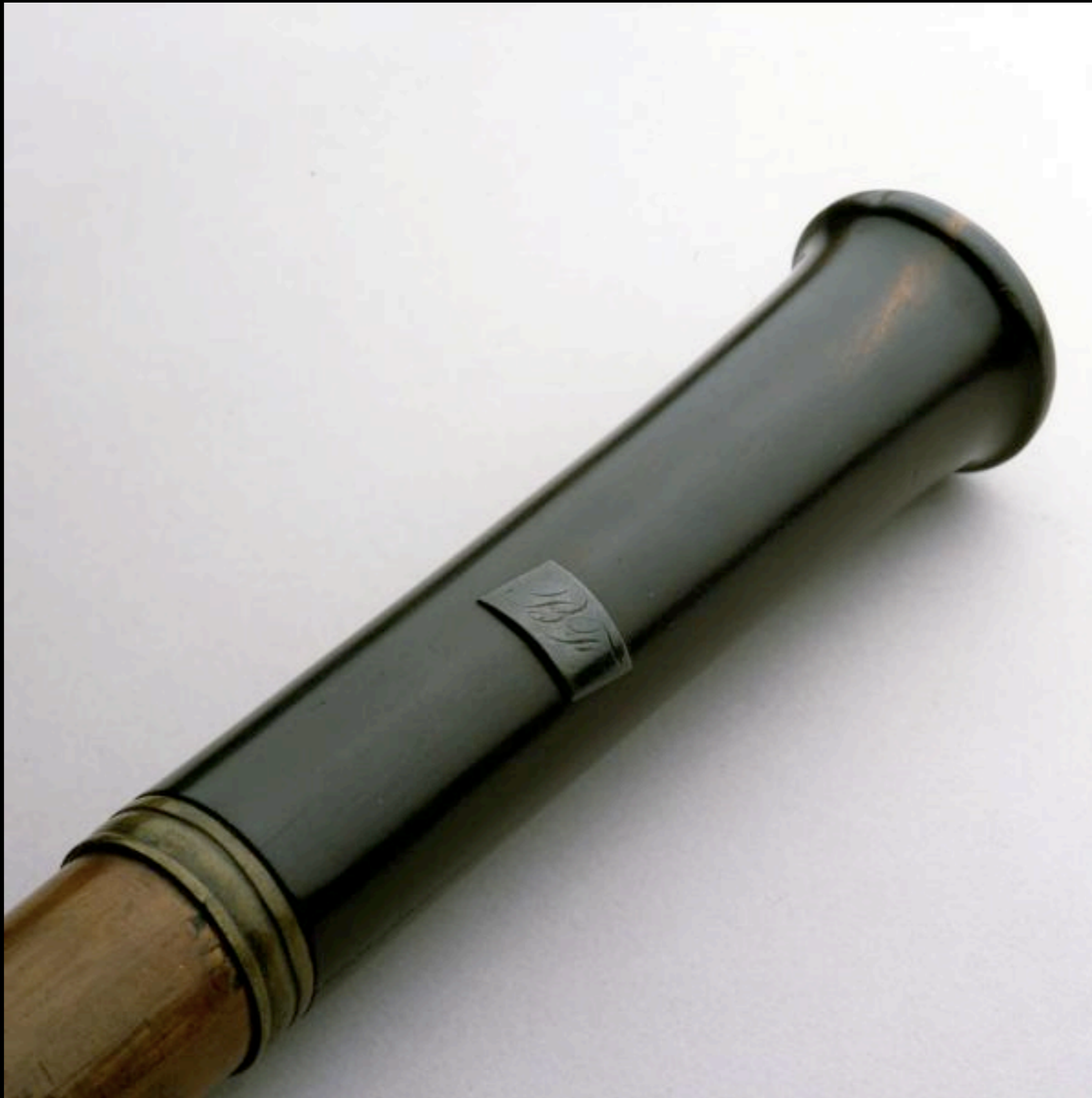
French Mahogany Walking Stick with Brass & Silver Owned by Benjamin Franklin & Given to the Marquis de Lafayette Late 18th Century