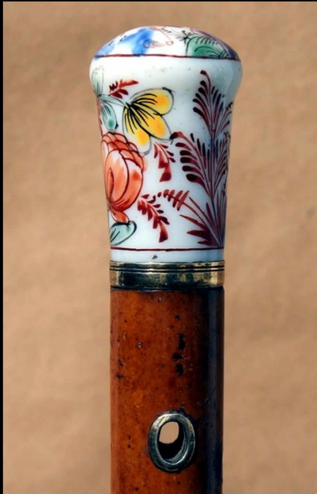
French or German Malacca Walking Stick with Opal Glass Chinoiserie Knob Handle, Silver Collar, & Silver Ring c. 1740 (Antique Canes U.K.)