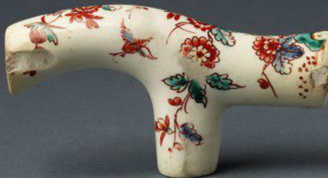
French Soft - Paste Porcelain Walking Stick Handle Mannaecy Porcelain Factory c. 1740 - 1745 (Victoria & Albert)