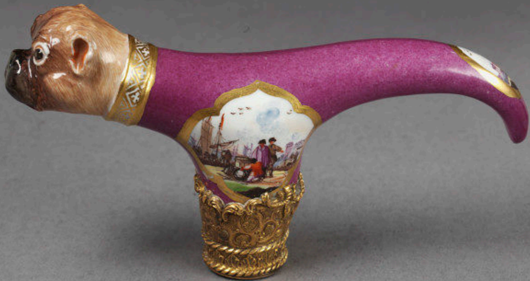
German Meissen Hard - Paste Porcelain Walking Stick Handle with Early 19th Century Gold Mount c. 1736 - 1740 (Victoria & Albert)