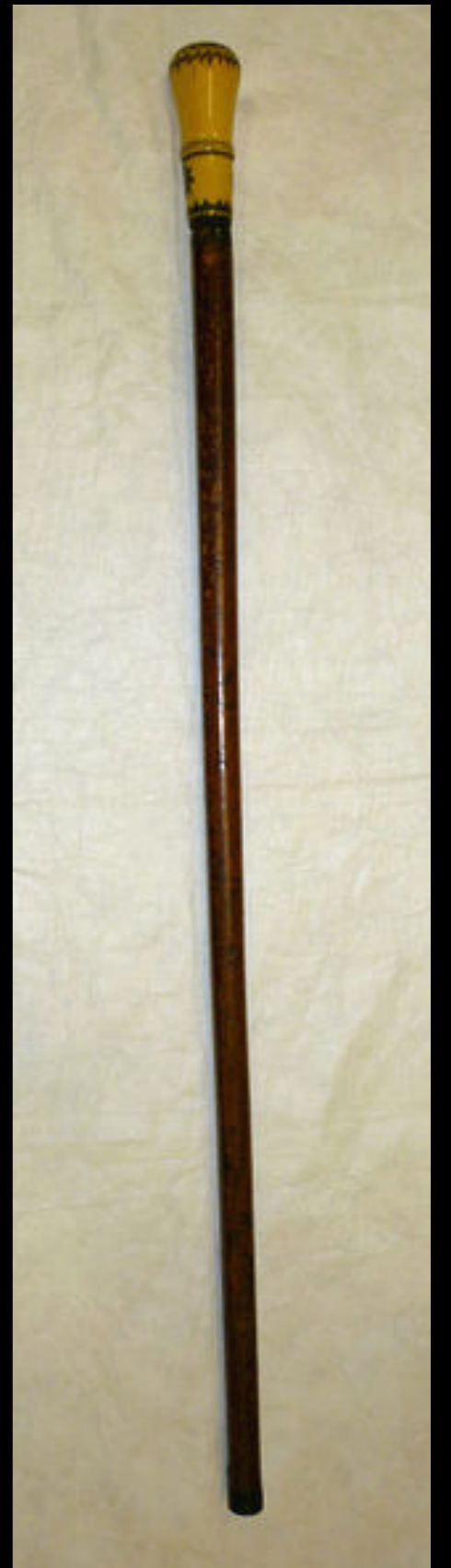
Dutch Malacca Walking Stick with a Silver Pique - Inlay Ivory Handle & Metal Ferrule Dated 1694 (Victoria & Albert)